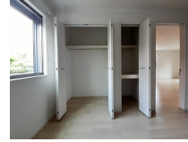
その他部屋・スペース